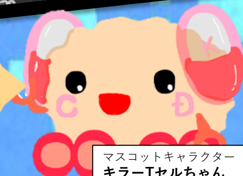
マスコットキャラクター キラ-Tセルちゃん

職員の健康等をきちんと管理していくことで 支援の質をより向上させていきます♪ 今後ともていーせるをお願いいたします！